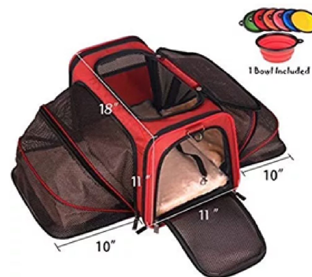
Imagen 3: Mochila Transportadora De Mascotas Expandible