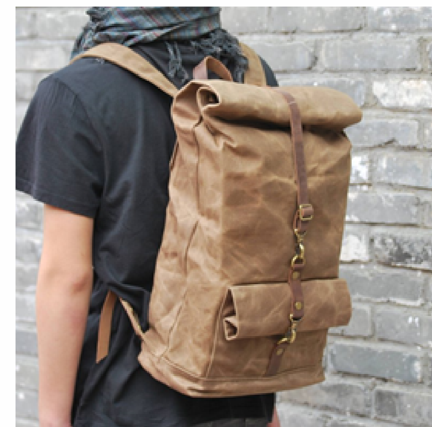
Imagen 2: Etsy