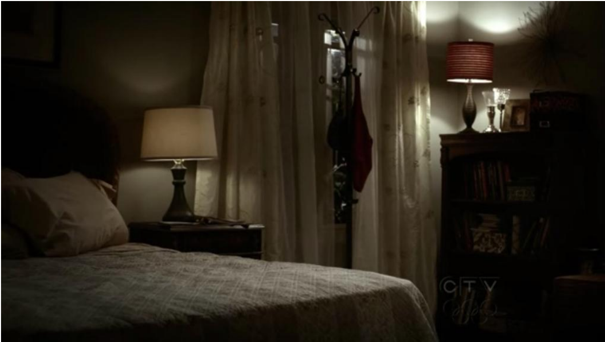
Serie: Diario de vampiros