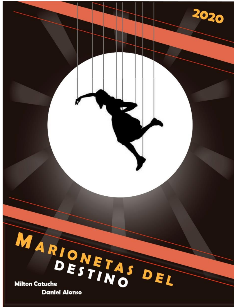
Ilustración 9 Ilustración 8 Fuente: Daniel Alonso - Poster Marionetas del Destino