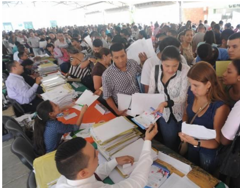
Ilustración 1

De lo anterior se puede ver que la búsqueda de empleo formal ubica solo el 15% en Colombia para encontrar una oportunidad, algo que, comparado con otros países es considerablemente pequeño. Y también, que la mayoría consiguen empleo de manera informal preguntándole a un amigo, es así como se hace fuerte la idea que se recalca al inicio “tener un contacto”.