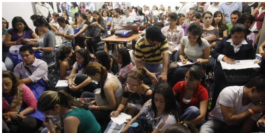
Ilustración 2.

¿Como se encuentra Colombia de acuerdo al desempleo en el último año, teniendo en cuenta la crisis de la covid-19? Según un artículo del EFE, para el tiempo: Los jóvenes y las mujeres, de acuerdo con la Ocede, han sido los más golpeados por la pérdida de puestos de trabajo durante la pandemia.