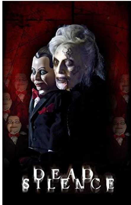
Ilustración 6

Pensamos en la posibilidad del elemento plus diferenciador y curioso, y llegamos a la conclusión del maquillaje marioneta en alguno de los personajes, algún personaje que apareciera durante buena parte de la historia, y para el maquillaje nos hemos basado en una película de un genero de cine de mi gusto: