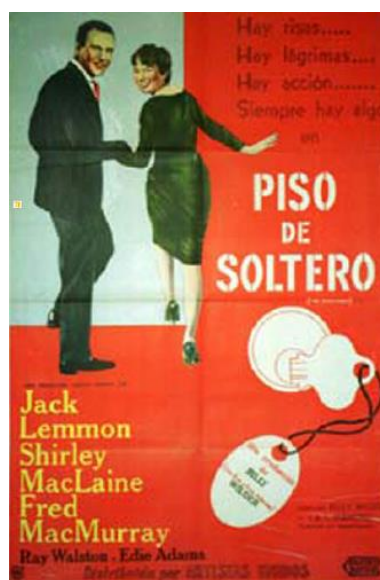
Ilustración 4

En: Piso de soltero 1960. El tema central es sobre una persona que desea obtener un ascenso a causa de prestar su casa para citas de sus jefes.