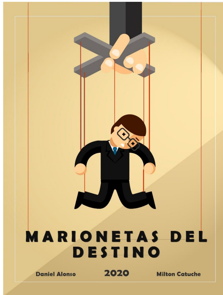
Ilustración 8 Fuente: Daniel Alonso - opción2 poster