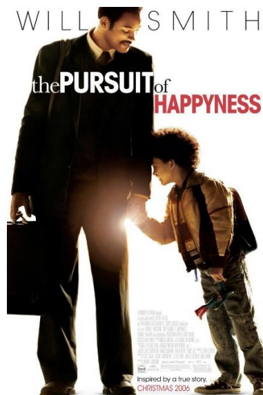
Ilustración 5

Empezamos a pensar en un acontecimiento general que pudiésemos mostrar la rosca a la hora de aplicar a una oportunidad de trabajo, apoyados también en la letra de la canción que hablaba sobre la falta de oportunidades que se le brinda a la gente, decidimos hacer una entrevista de trabajo, mostrando todo el proceso de selección, apoyados en experiencias propias y referentes de películas como: En busca de la felicidad.