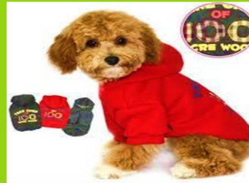
Camiseta con mangas