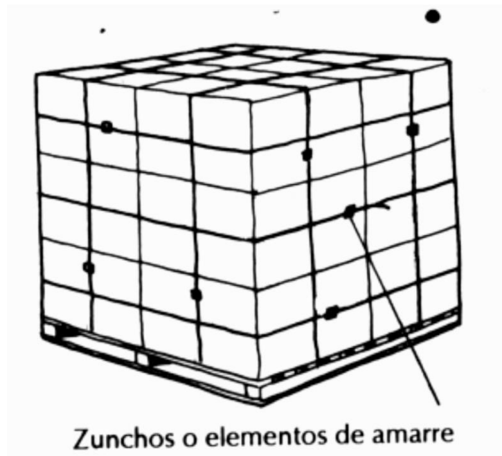
Zunchos o elementos de amarre