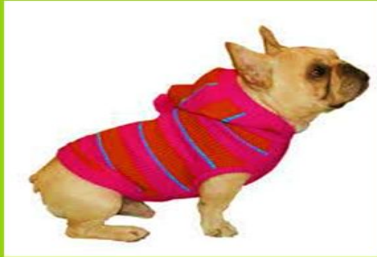
Camiseta sin mangas

Unidad de Emprendimiento y Liderazgo de la CUN