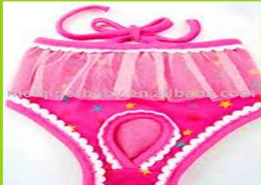
Cucos y Calzoncillos