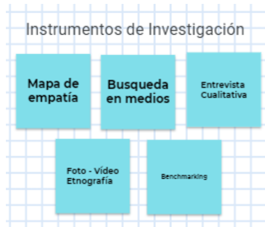
Figura 1: Imagen presentada en la recolección de datos.