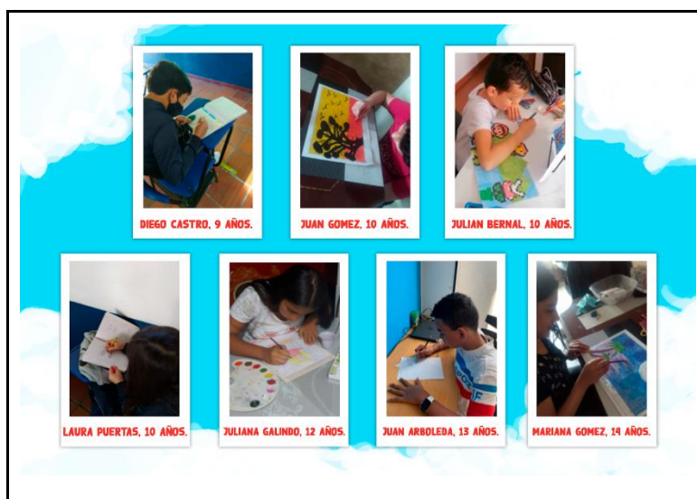
Figura 6: Recopilación de imágenes, junto a simulación de talleres ilustrativos a los niños.

El proyecto ha sido desarrollado con base a los “instrumentos de investigación”, que se realizó a un grupo de siete personas que poseen edades entre los 8 y 15 años, incluyendo a los respectivos padres de familia, en la ciudad de Ibagué. Donde se incluyó un acompañamiento y simulación donde se relaciona el propósito de “La casa del árbol”, el cual compete el conocimiento, interés y el apoyo a las artes ilustrativas en los usuarios.