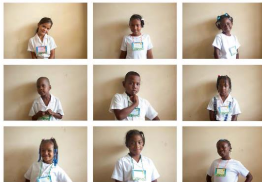
Figura 4. Niños y niñas, CDI El Guadual, institución de la Estrategia Nacional de Atención Integral a la Primera Infancia 'De Cero a Siempre'.

Cultura e identidad Afro, entre los extensos cañaduzales que caracterizan la geografía del Cauca, los habitantes de del municipio de Villa Rica mantienen vivas las esas raíces culturales africanas entre ellos, como espectáculo folclórico, pero también como cotidianidad y como resistencia al abandono o la pobreza. En donde se construye el CDI El Guadual, que permite la libre expresión y formación artística de bailarines, músicos albergando una enorme alegría, demostrando que este tipo de espacios se convierten en focos de organización cultural y puntos de encuentro entra la comunidad.