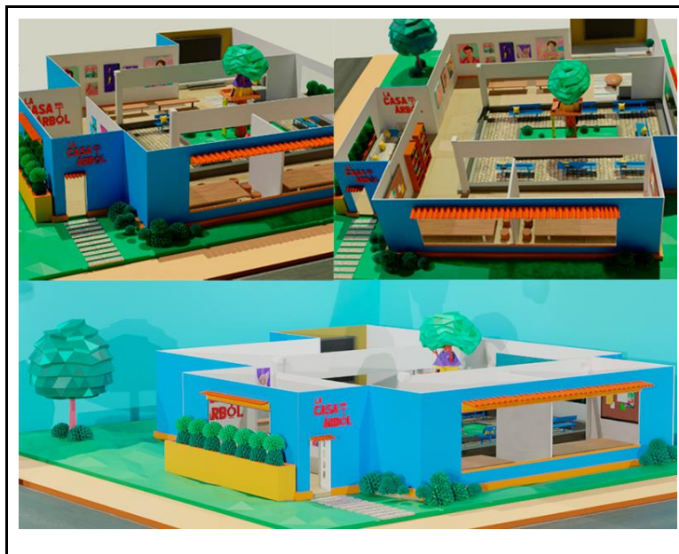
Figura 2: Presentación realizada en 3D, donde se expone la estructura de “La Casa del Árbol”.