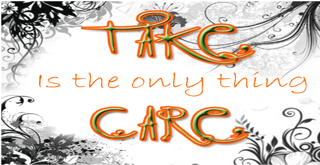
Imagen 2, Logo y Slogan Take Care S.A.S.