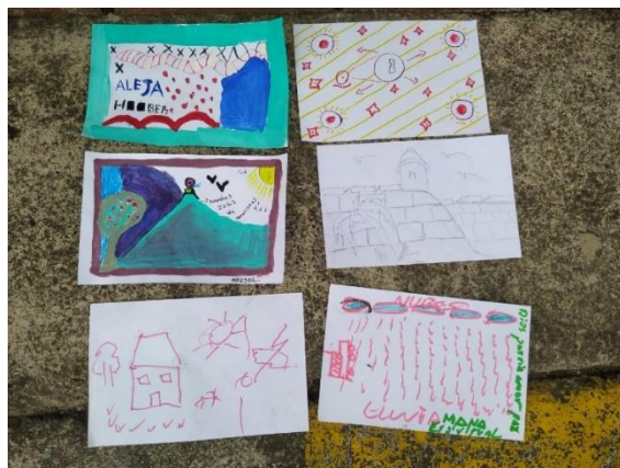
Figura 3, Fotografía Propia (24/10/2022)