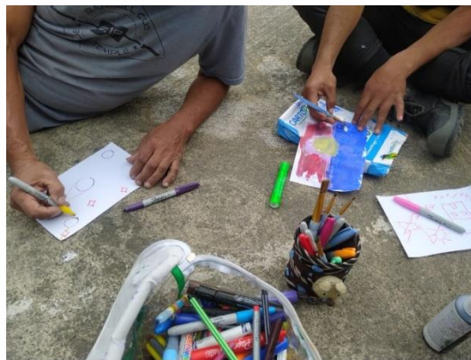
Figura 2, Fotografía Propia (24/10/2022)