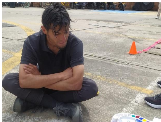
Figura 5, Fotografía Propia (24/10/2022)