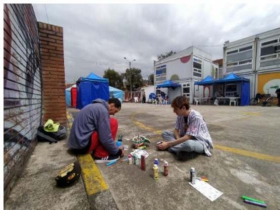
Figura 1, Fotografía Propia (24/10/2022)