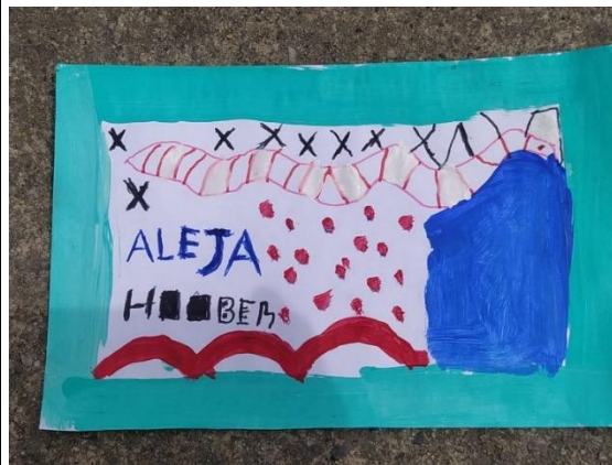
Figura 4, Fotografía Propia (24/10/2022)