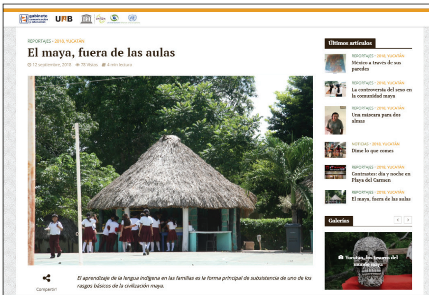
Gráfico 2 Ejemplo de reportaje elaborado por expedicionarios

Existen diferentes talleres que, en todos los casos, pretenden que los expedicionarios se ejerciten en la producción sobre el terreno de contenidos periodísticos a partir de la utilización de las técnicas y rutinas de producción periodísticas y del aprovechamiento de los diferentes atributos informativos que poseen a su alcance (Ver Gráfico 2).