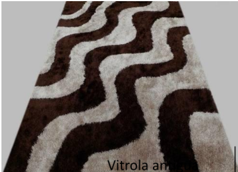
Vitrola antigua color café.