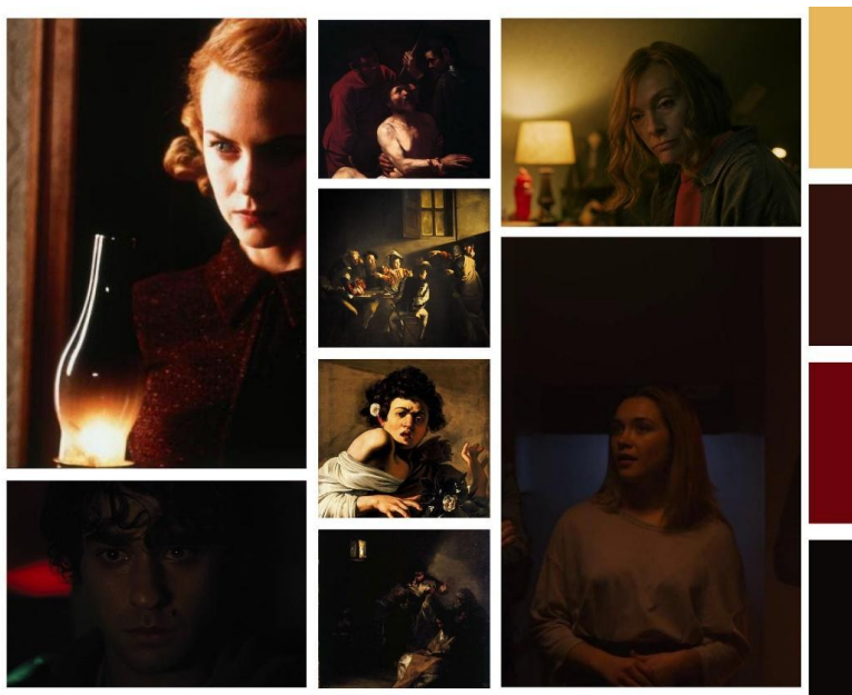
Figura 2, The others y Midsommar

Nota: (Alejandro Amenábar, 2001. Ari aster, 2019)