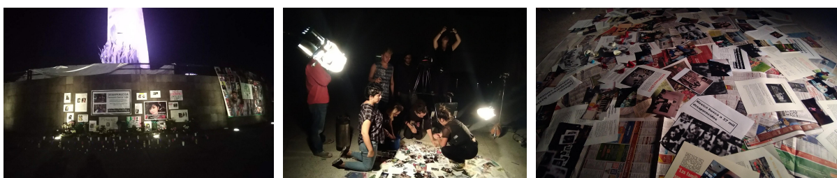
Nota: González Reyes Laura (2019) Detrás de cámaras Videoclip [Fotografías].