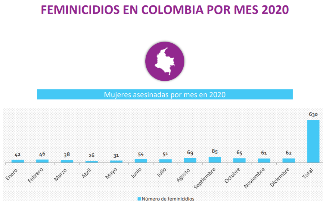
Figura 1. Listado de Feminicidios por mes en el año 2020