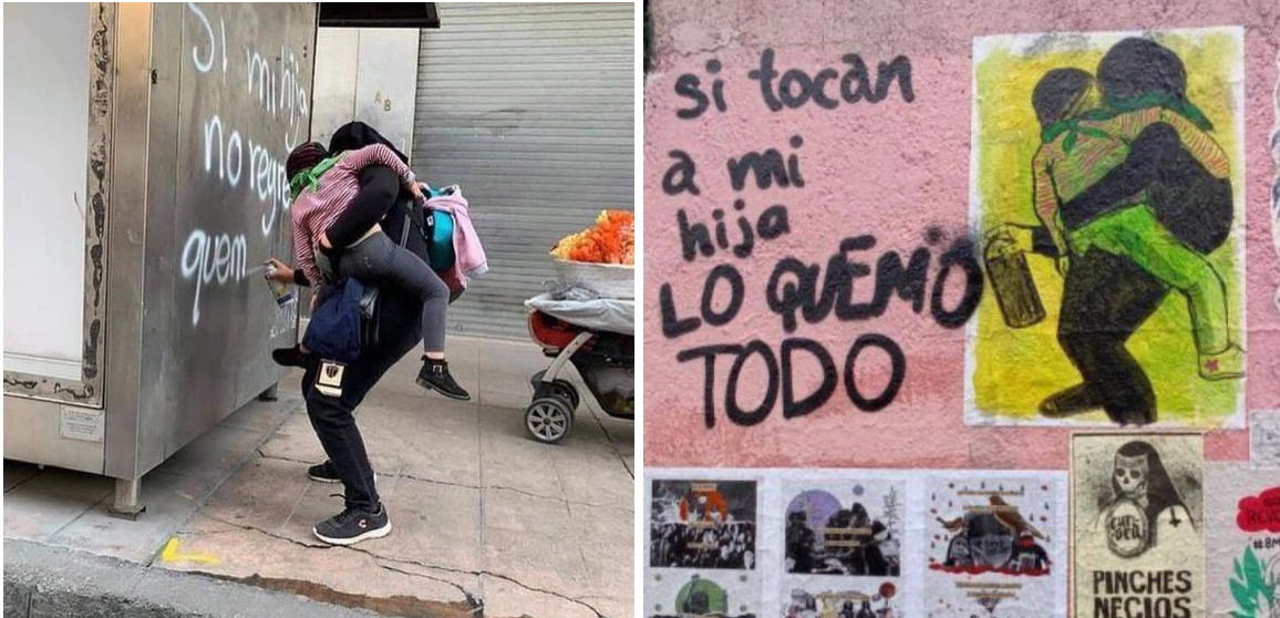
Figura 32 y 33

o temor frente al proceso, son la dosis de rabia o indignación, que me sirven de motivación para resolver las preguntas o encontrarle rumbo a la historia.