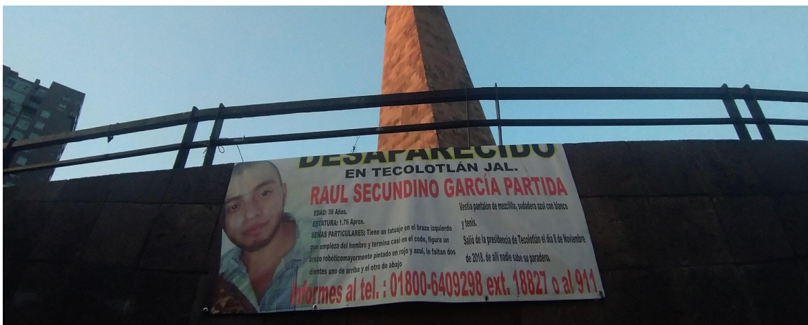
Nota: González Reyes Laura (2019) Plaza de los desaparecidos Guadalajara [Fotografía]

El tema ya estaba comenzando a rondar por mi cabeza y generar rabia, para mi era demasiado, en todo lado veía avisos, carteles, comerciales, periódicos de gente siendo buscada, hasta en la facultad de cine durante el periodo que estuve allí permaneció sobre un vidrio de rectoría alrededor de 36 fotos de chicos y chicas universitarias, desaparecidas, asesinadas y algunas conmemoradas desde la matanza de tlatelolco en el 68, historia que a los Mexicanos aún les duele, parece que ellos sí tienen memoria y que además fue una constante en la clase de psicología del cine, recuerdo un debate sobre el tema por la película