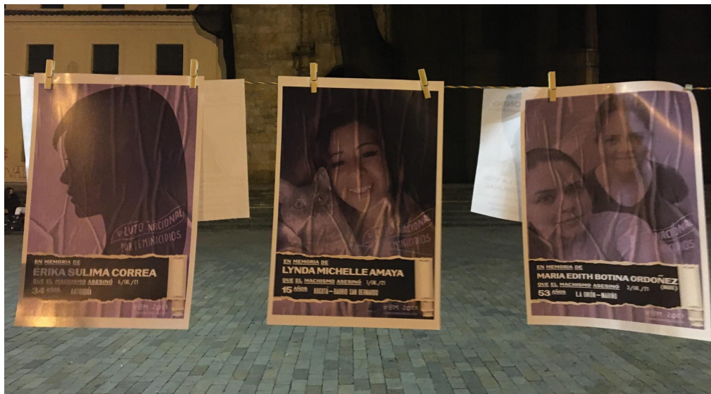
Figura 18 Concierto y velatón.