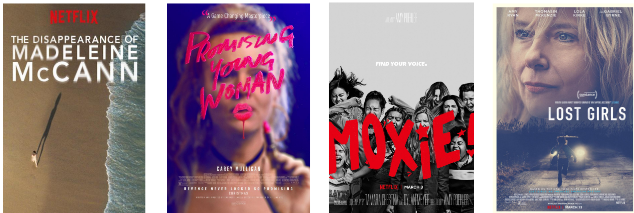
Figura 19, 20, 21 y 22

Nota: Gráficas recuperadas de google imagenes [posters]