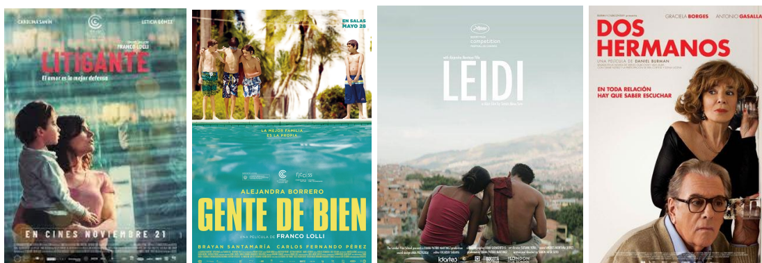
Figura 23, 24, 25 y 26

Nota: Gráficas recuperadas de google imagenes [posters]