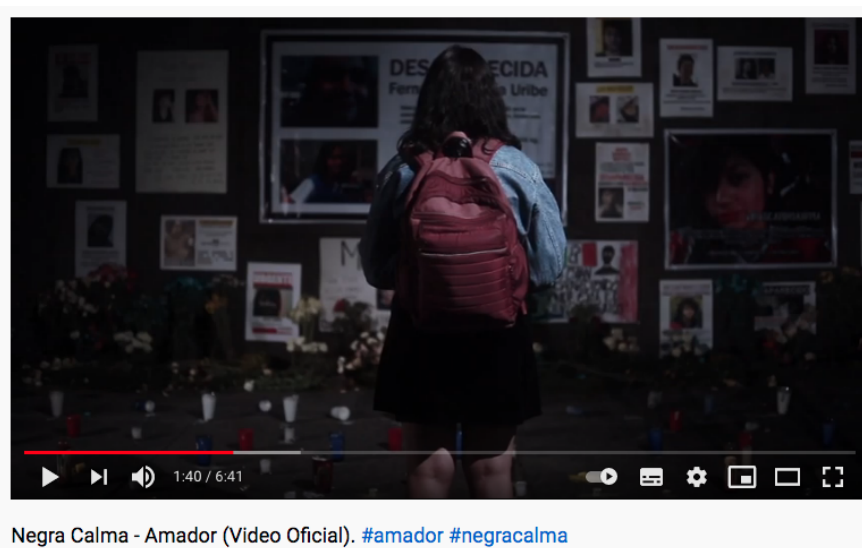
Nota: Fotograma Video Clip Negra Calma.

https://www.youtube.com/watch?v=BhwKJ9G9XZA