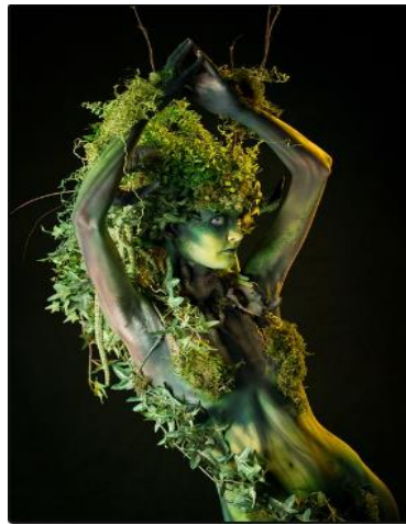
Imagen 7. Árbol en Bodypainting

https://poramoralarte-exposito.blogspot.com/2018/05/richard-james-oliver_29.html