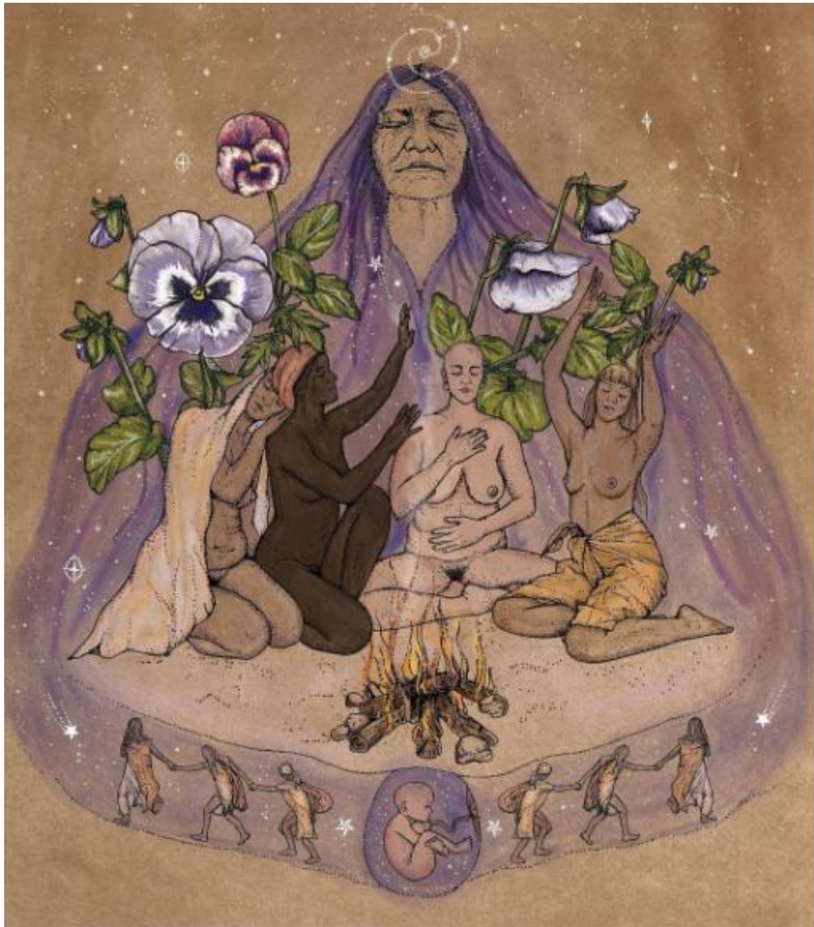
Imagen 11: Ciclo de la vida y la naturaleza

https://www.instagram.com/p/CMKRFG6hc9r/?igshid=7xoecetjekab