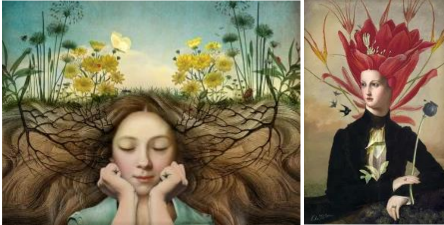
Imagen 8 y 9: Flores surrealistas

Para la escena de las flores me gustó la obra de Catrin Welz-Stein, quien tiene una extensa obra con flores surrealistas.