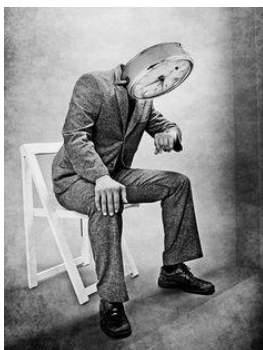
Imagen 4. Hombre Reloj