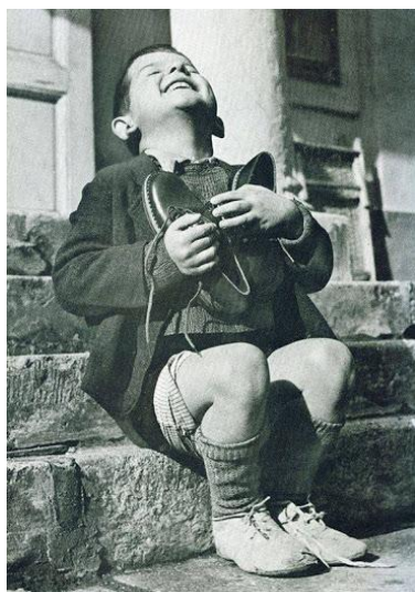
Imagen 1: Menino austríaco ganhando sapatos novos no fim da Segunda Guerra Mundial.

Este cortometraje es el resultado del compendio de varias de las clases que he tenido la oportunidad de cursar en la CUN, ya que soy homologada del programa de Escritura del SENA. Entre ellas está la clase de Apreciación Audiovisual, dictada por el profesor Clemente Arias, en el segundo semestre del 2019. Uno de los ejercicios consistió en hacer una historia a partir de una serie de fotos que marcaron la historia de la humanidad. Entre las imágenes que elegí para armar el relato se encuentran estas: