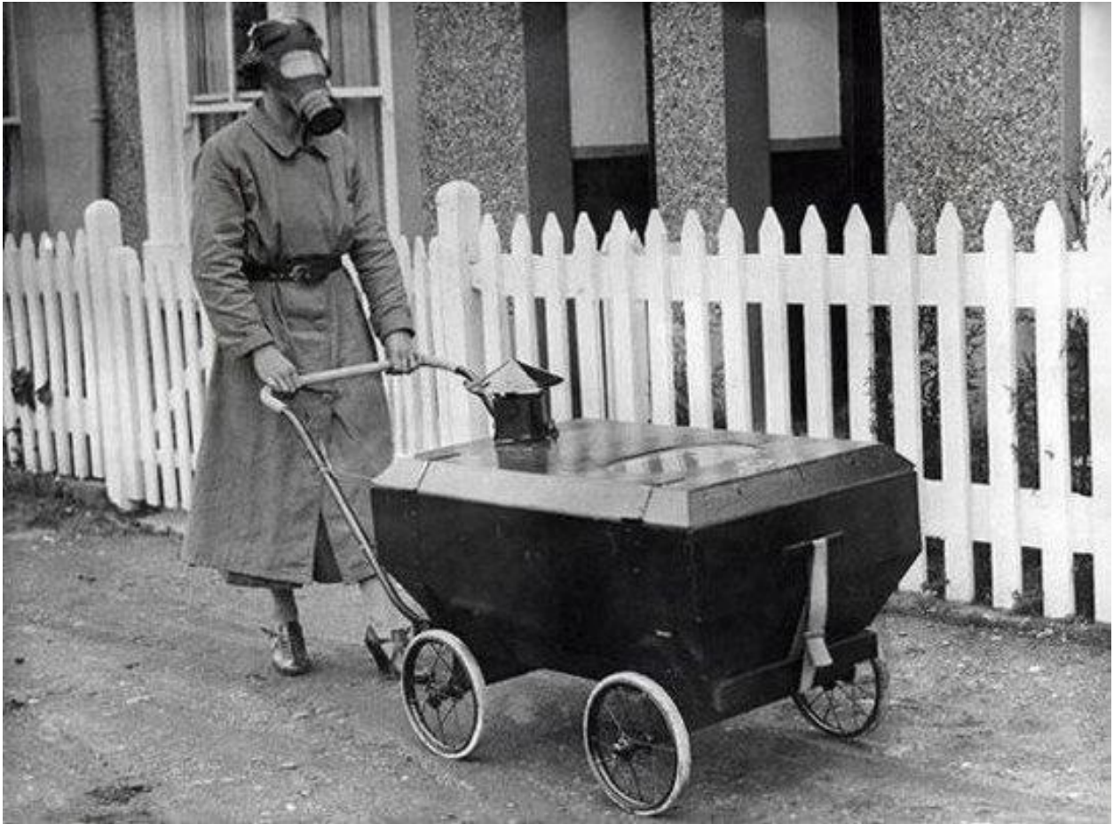
Imagen 2: Gas-proof baby carriage, 1938

https://www.reddit.com/r/HistoryPorn/duplicates/2422hw/gasproof_baby_carriage_1938_3500x