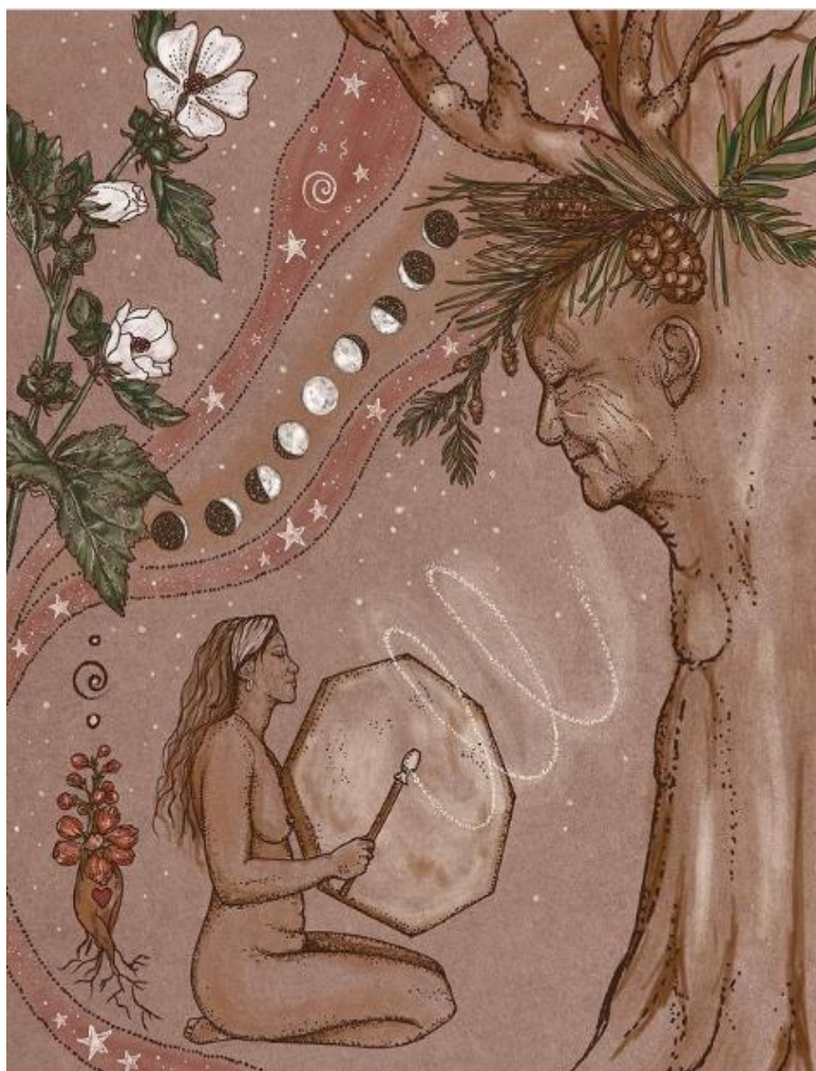
Imagen 10: Mujer y árbol

https://www.instagram.com/p/CKHFRV3BKPG/?igshid=1cponrsis4d3y