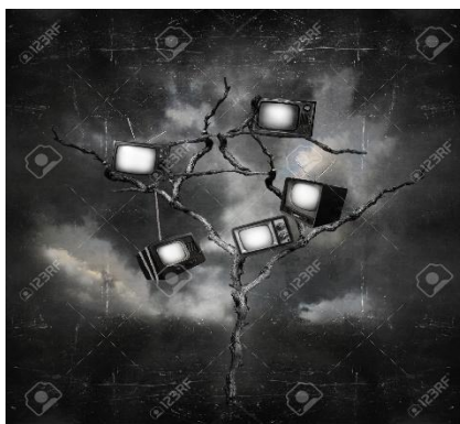
Imagen 3: Árboles que portan pantallas

Para esa ocasión mis imágenes que reforzarían la distopía serían las siguientes: