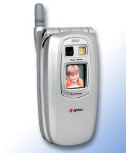
Figura 9. Sprint PM-8920

https://www.macromovil.com/la-historia-de-la-camara-del-movil/