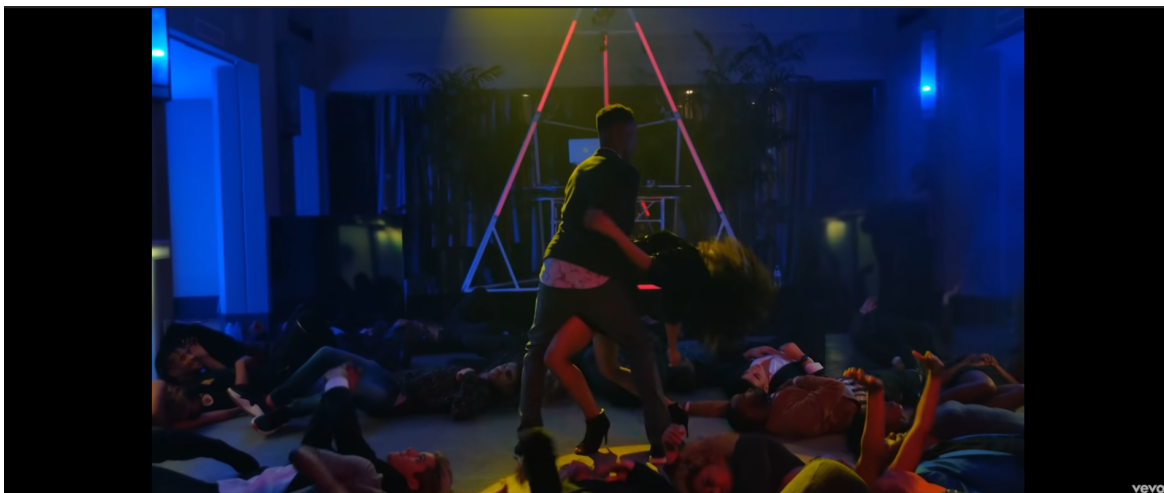
Figura 14. A GOOD NIGHT, JOHN LEGEND