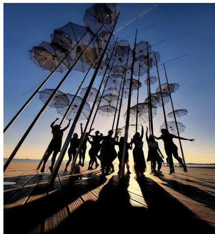
Figura 4. Ganador categoría "Silhouettes"

https://i.blogs.es/24a0e9/portrait/1366_2000.jpg