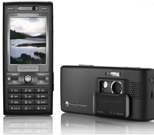
Figura 11. Sony Ericsson K800

Con este crecimiento de celulares con cámara fotográfica un principal competidor de Nokia era Sony Ericsson el cual ya había entrado al negocio de las cámaras digitales en el mercado decidió competir con un celular de una apariencia similar a una cámara. En 2006 lanza el Sony Ericsson K800 el cual contaba con una cámara de 3.2 Megapíxeles autofocus, video, flash xenón y cámara secundaria para videollamadas.