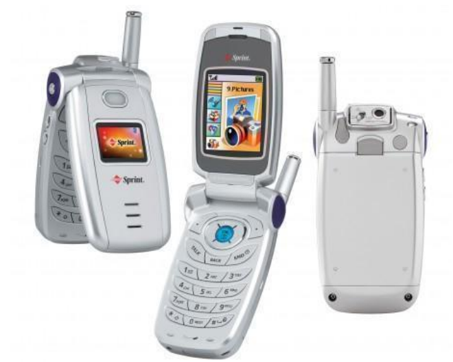
Figura 8. Sanyo SCP-5300

Comenzaría la nueva década y con ella se vendrían maravillosos cambios para la fotografía celular uno de los quienes tuvo una gran acogida en estos años fue Sanyo, la marca de teléfonos japonesa lanzaría el SCP-5300 en 2002, esta tenía la novedad de traer Flash, Zoom digital, balance de blancos y control de tono. Como vemos cada vez están interesados en agregarles más detalles a las cámaras de los celulares. Sprint distribuidor de Sanyo decidió apostar en el mercado estadounidense con su propio Audiovox PM-8920 el cual al igual de que el de Sanyo tendría mismas características, pero siendo presentado como el primer teléfono con resolución de megapíxeles en el mercado con 1.3 Megapíxeles.