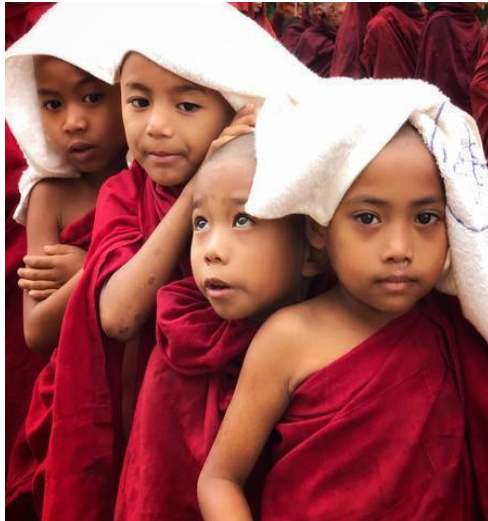
Figura 2. Ganadora categoría "Eyes of the World"

https://i.blogs.es/f71bfc/we-run-you-fly-by-dimpy-bhalotia/1366_2000.jpg