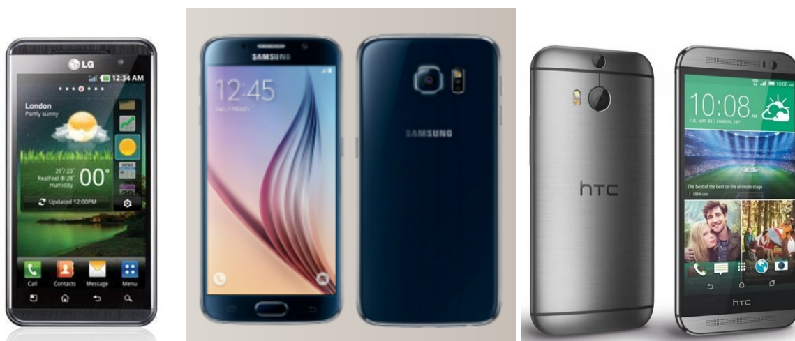
Figura 12. LG Optimus 3D, Samsung Galaxy S6 Y HTC M8

En 2011 creció la moda del 3D y claramente los teléfonos lo aprovecharán, como LG con su LG optimus 3D Grabando a 5MP pero 3D en tiempo real. En 2016 Samsung innovaría con su sensor CMOS DE 18MP y Video en estándares 4K, con tantos sensores las compañías no veían estético el uso de lentes grandes en sus celulares entonces fue cuando comenzaron a utilizar diferentes lentes en la cámara uno de los primeros fue One M8 de HTC que aunque no eran impresionate sus cámaras comenzaban a tener un mejor diseño. Marcas como LG decidieron apostar a colocar gran angulares.