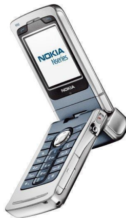
Figura 10. Nokia N90

En 2005 Nokia quien lideraba los mercados decide lanzar su primer teléfono de la línea N la cual tendría gran acogida por el público por su peculiar estilo siendo enfatizado en la cámara, hablamos del Nokia N90 con una cámara de 2.0 Megapíxeles, lente con auto foco para captura de video con alta calidad. Este era un teléfono plegable el cual podría girar en 90° su eje al momento de grabar, siendo muy vistosa al igual que una cámara de video de la época