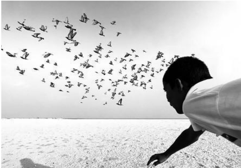
Figura 1. Ganador categoría "Black & White"

Dimpy Bhalotia con 'We Run, You Fly'