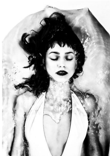
Figura 3. Ganadora categoría "Portraits"