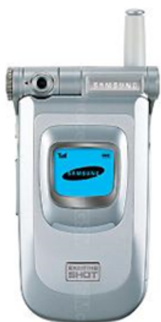
Figura 6. Samsung FFsch-v200

Dos de las grandes compañías asiáticas como lo son Sharp corporation y Samsung lanzan sus primeros diseños de celulares con cámara fotográfica, estas lograrían un éxito tanto en sus países como en el exterior. Samsung presentó el novedoso SCH-V200 el cual podía tomar fotos en 0.35 megapíxeles y Sharp se iría con su J-SH04 con 0.011 Megapíxeles y la posibilidad de enviar las fotos por correo electrónico.