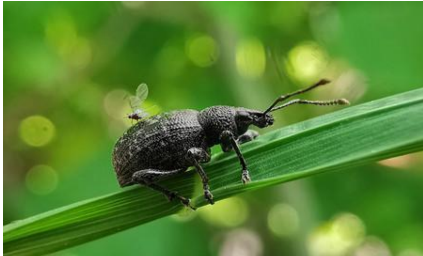
Figura 5. Ganador categoría “Macro & Details”

Jaroslav Bryla con ‘Stowaway’