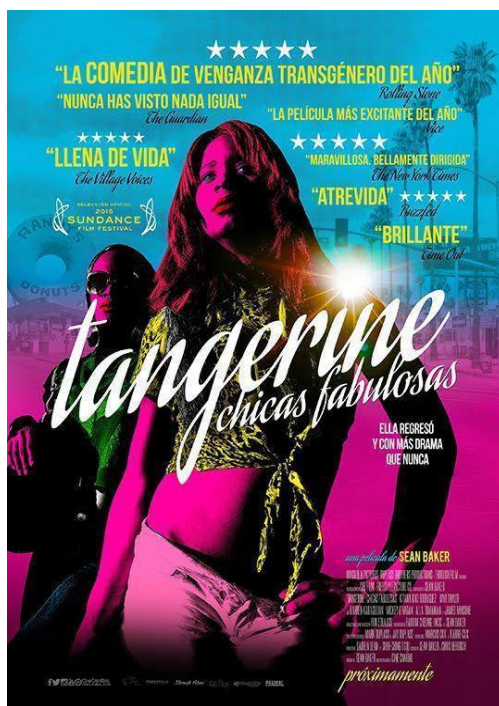
Figura 15. TANGERINE, 2015

https://www.youtube.com/watch?v=KORq9FZqNj0