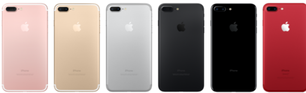
Figura 13. Iphone 7+

Un grande en esta guerra de cámaras será Apple quien para el 2014 implementando píxeles de enfoque y sus 8 MP eran la sensación y con su lanzamiento del iPhone 7 plus teniendo dos cámaras de 12MP con zoom de 23 y 56 mm.