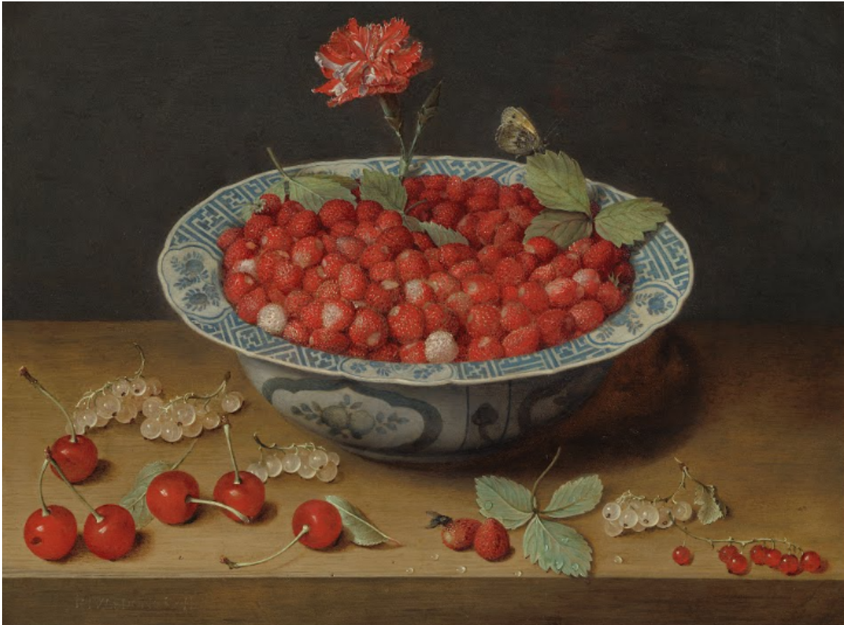
Ilustración 4: Jacob van Hulsdonck. (1620) Fresas y un clavel. Pintura.