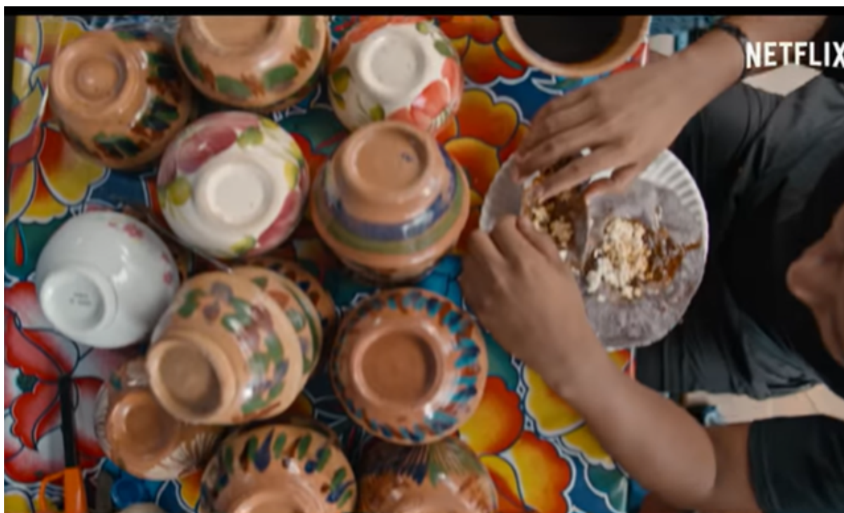
Ilustración 2: S.A. (2020) Street Food Latinoamérica - Episodio 6 (Colombia). Serie documental.

Esta serie documental muestra historias segmentadas y profundas de personas que se desenvuelven en el ámbito culinario como su forma de vida. Le aporta al proyecto audiovisual desde la composición de la imagen, la colorimetría y la narrativa, ya que, la idea del proyecto sembradores también interviene la presentación de historias segmentadas y su relación con el entorno.