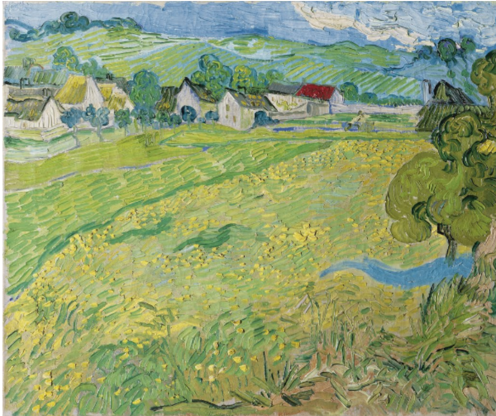
Ilustración 5: Vincent van Gogh (1890) “Les vassenots” en Auvers. Pintura.

Esta obra de arte representa de forma clara y específica un proceso conceptual en términos de paisaje artístico, donde el color resalta la belleza y se ve relacionado con el proyecto audiovisual intrínsecamente, como un ejemplo claro de los planos que se esperan lograr en la construcción de la imagen, haciendo énfasis en el uso de la luz natural como medio para aprovechar la textura y nutrir de profundidad el cuadro cinematográfico, dando protagonismo progresivo a los elementos.