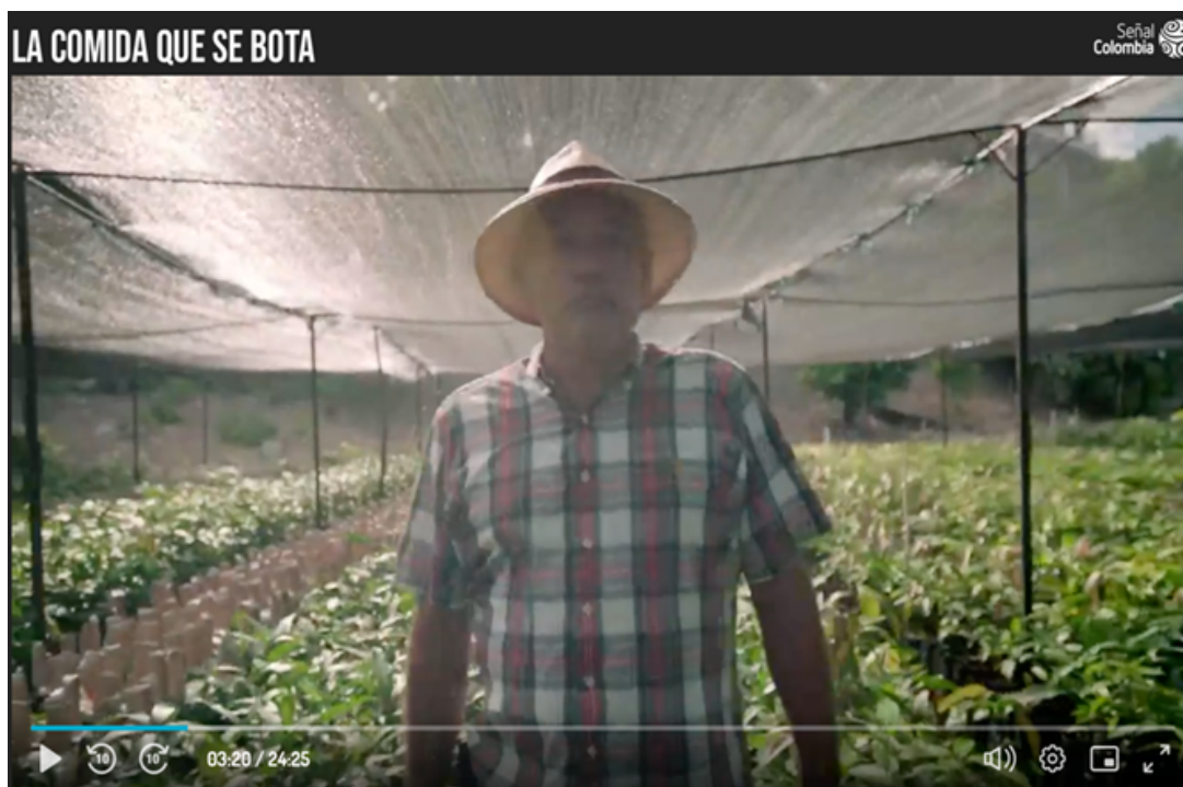
Ilustración 1: S.A (2019) Expediente ingrediente. Serie documental.