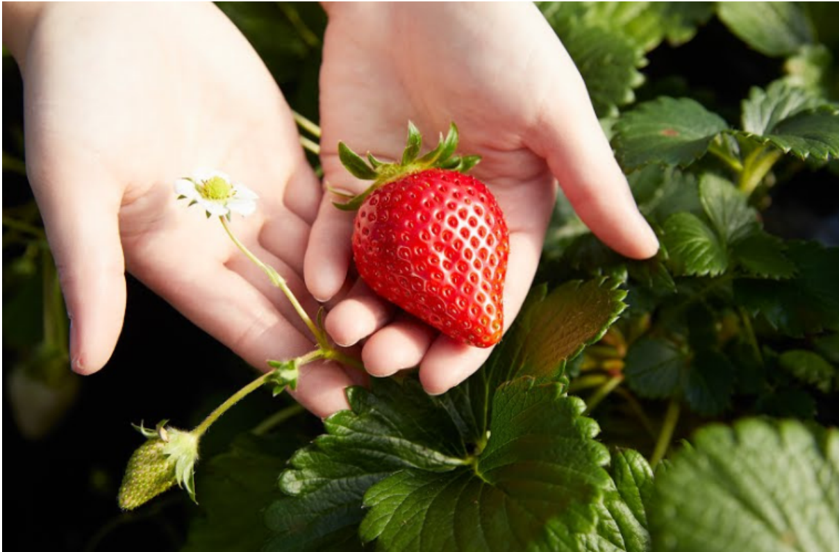
Ilustración 3: Ministerio de Agricultura de Japón (2022) Strawberries of Murata Farm.