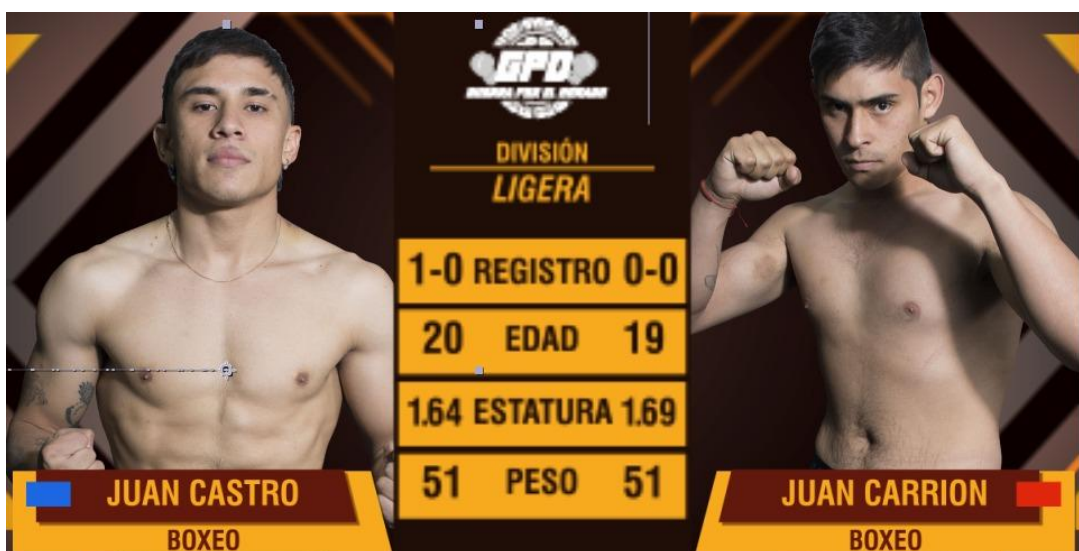
Imagen de Creación Propia