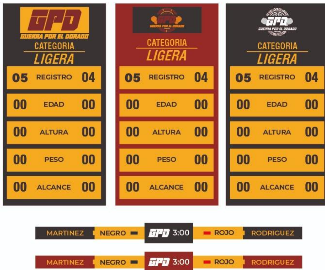
Imagen de creación propia