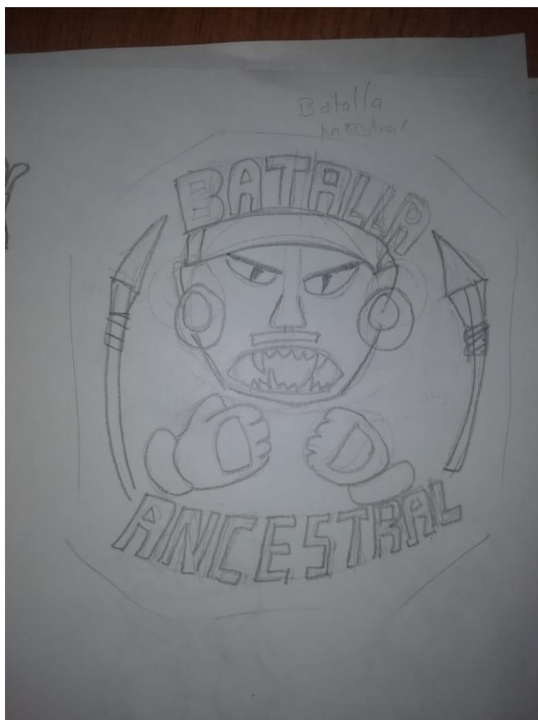
Imagen de Creación Propia

Se prosiguió en la búsqueda de un nombre, tenía que ser algo que se pudiera simplificar a un par de siglas, con temperamento y que diera en nuestro centro identitario, opciones como los guerreros Guechas, que era como se conocía a los guerreros Muisca por parte de los españoles en las épocas coloniales fueron las primeras, Batalla Ancestral, entre otras, por último y