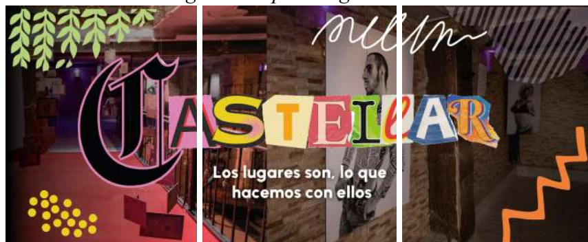
Autor: Samuel Lagos Angarita