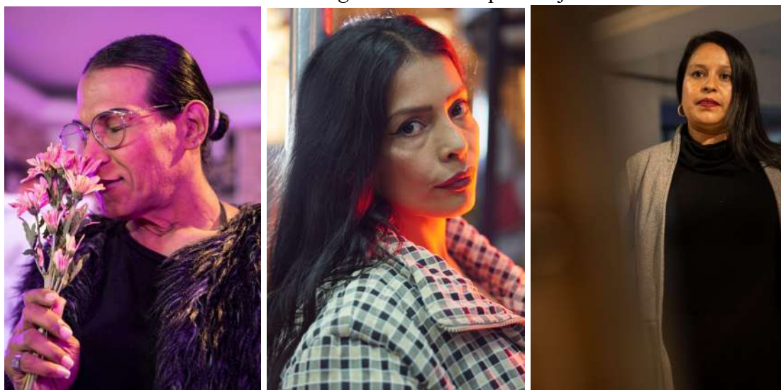
Autor: Samuel Lagos Angarita