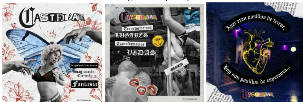
Autor: Samuel Lagos Angarita