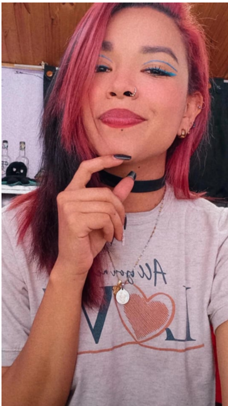
fotografía publicada con consentimiento de la modelo.

• No lo tomaron para nada bien, yo les explique que era la mejor opción en el momento, ya que me estaban pagando muy bien y no estaba trabajando muchas horas.