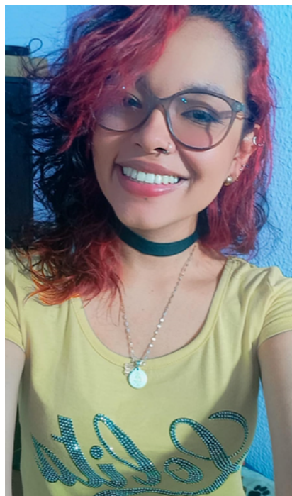
fotografía publicada con consentimiento de la modelo.

• Por supuesto que no, en el modelaje webcam nadie te toca más que tú misma, jamás hay contacto con los clientes, así como tampoco hay un pago diario, el pago lo hacen las diferentes páginas web cada quincena y es una recopilación de todos los espectáculos que realizaste en la quincena.