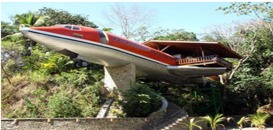
Figura 2: Planos