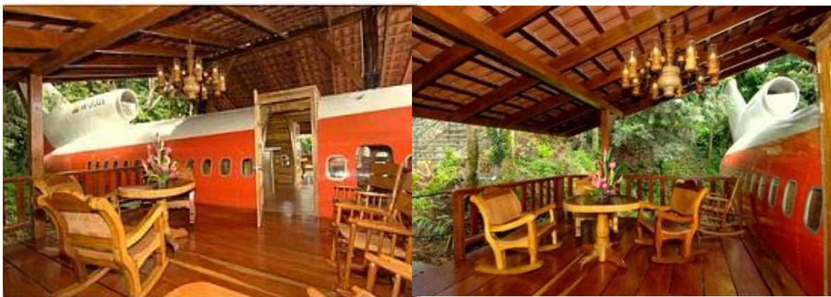
Figura 2.2 Exteriores