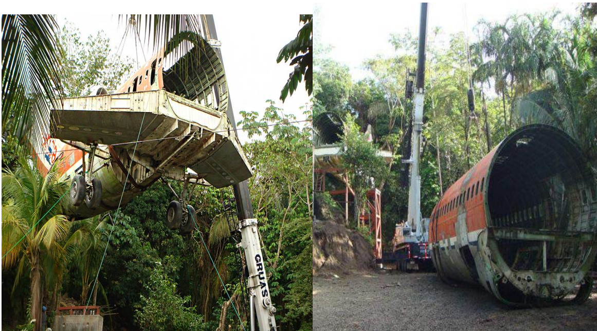
Figura 1: Prototipo

Nuestro Hangar Turístico resaltara en su diseño de construcción puesto que sus hoteles tendrán la forma de avión, el cual se construirá con materiales reciclados de los aviones antiguos, esto en su exterior y en sus interiores contara con una infraestructura de madera para graduar la temperatura de su interior.