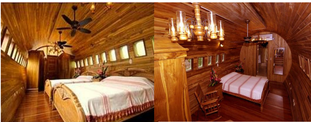
Figura 2.1 Interiores