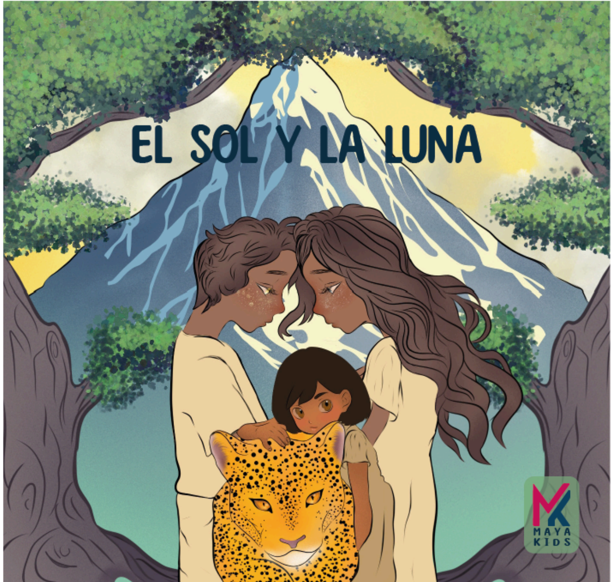
Imagen 4: Portada del libro, autoría propia, 2024