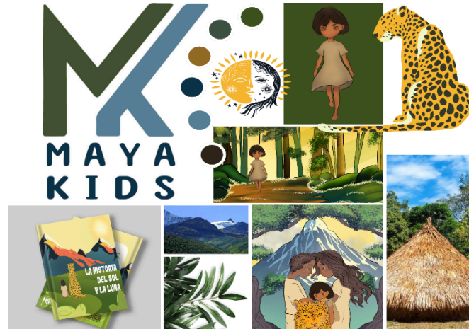
Imagen 1: Moodboard – Identidad de Maya Kids, autoría propia, 2024