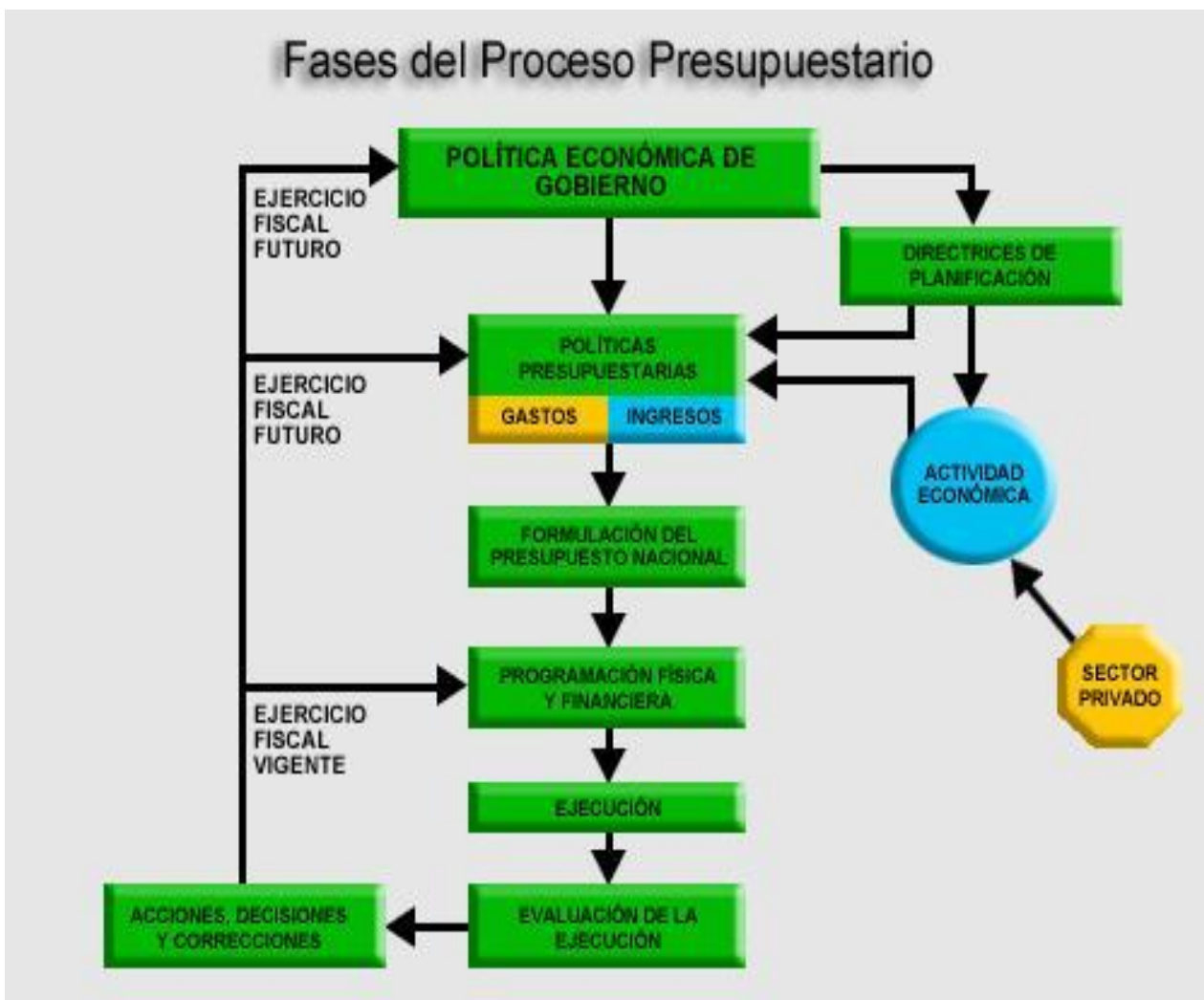
Ilustración 3

A continuación en la ilustración 3 se explica de una forma fácil y comprensible las fases del proceso presupuestario, las cuales debemos tener en cuenta: