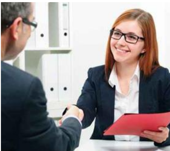
Figura 2. Sala de Negocios