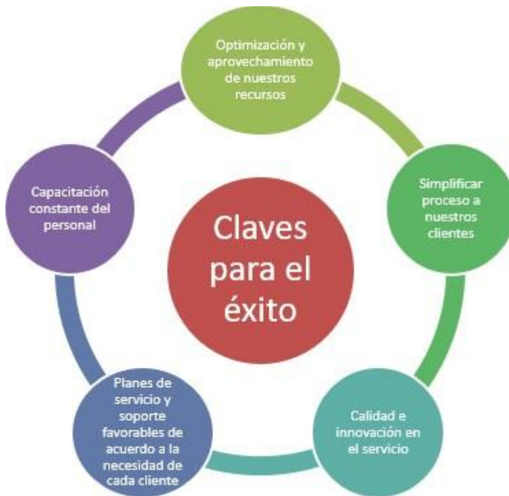
Figura 1. Claves para el Éxito