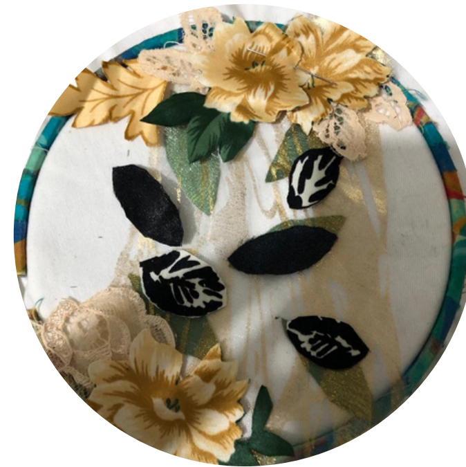
DECHADO DE RETAZOS