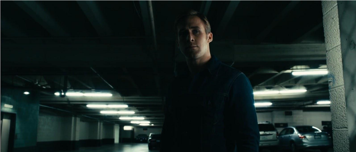
Drive (2011) Dir: Nicholas Winding Refn

Con estos ejemplos quiero mostrar los colores que quiero usar en el personaje. De Drive me gusta la manera como se maneja la iluminación en la piel, creando un blanco frío.