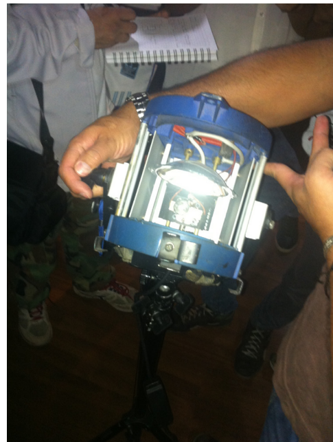
LUZ FRESNEL, TUNGSTENO 3200°K