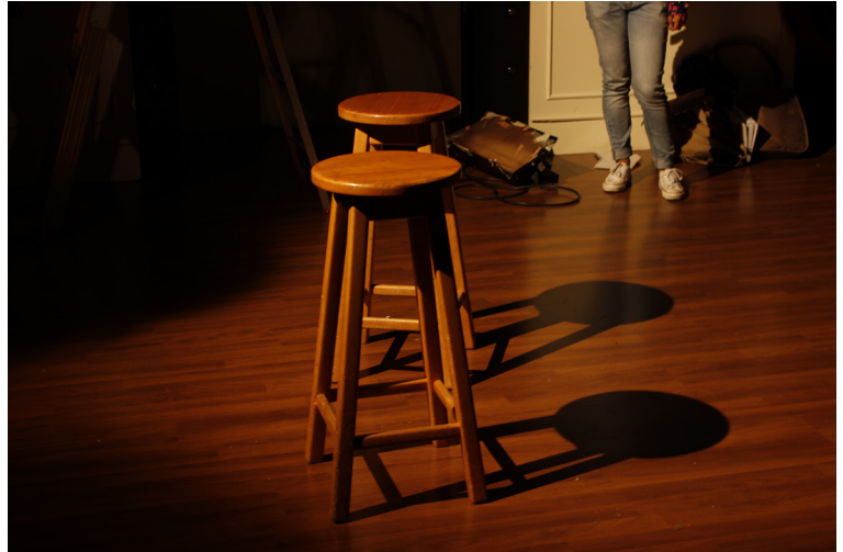
ESQUEMA DE ILUMINACIÓN BÁSICO PARA DOS OBJETOS.

CUANDO HAY VARIOS GRUPOS DE PERSONAS SE PUEDE ILUMINAR EL CONJUNTO O POR SECCIONES, UTILIZANDO UN TRIANGULO DE ILUMINACIÓN BASICO.